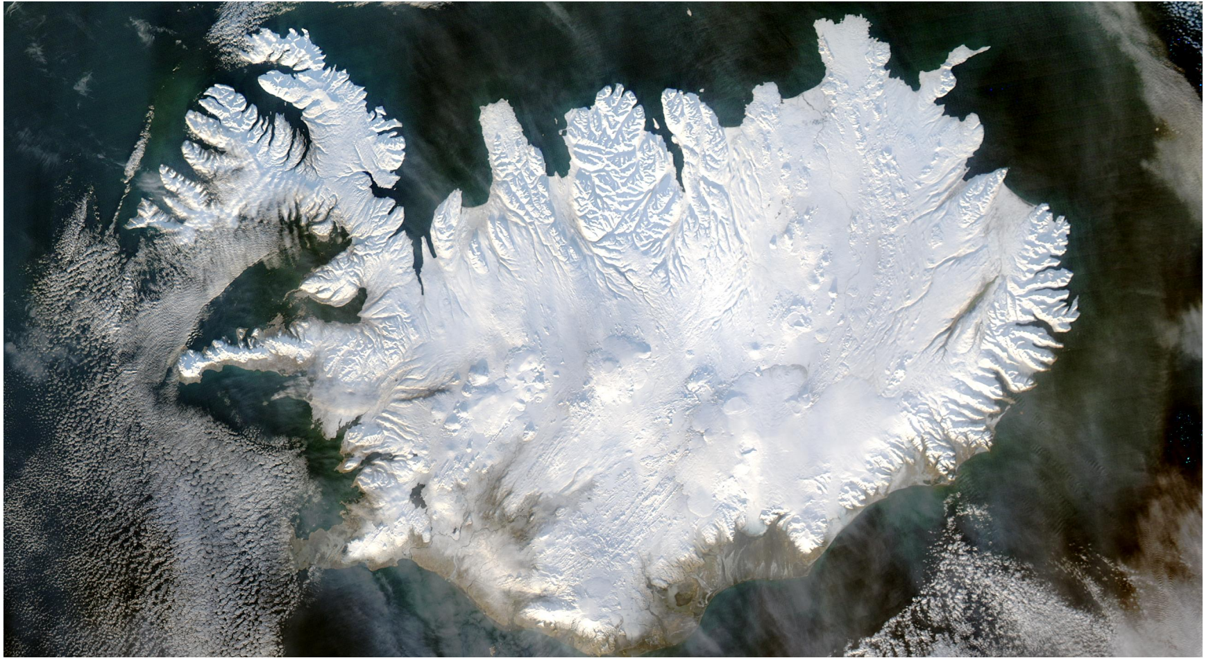
Flutningar á Íslandi til 2030 - Íslenski sjávarklasinn