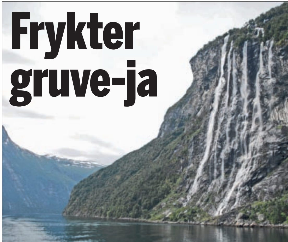
TIL AVFALLSDUMPING?: Norges Fiskarlag savner en tverrfaglig grundigere gjennomgang om hvordan utslipp påvirker næring og mattrygghet.

Han er også kritisk til at de offentlige insititusjonene som har forvaltningsansvar