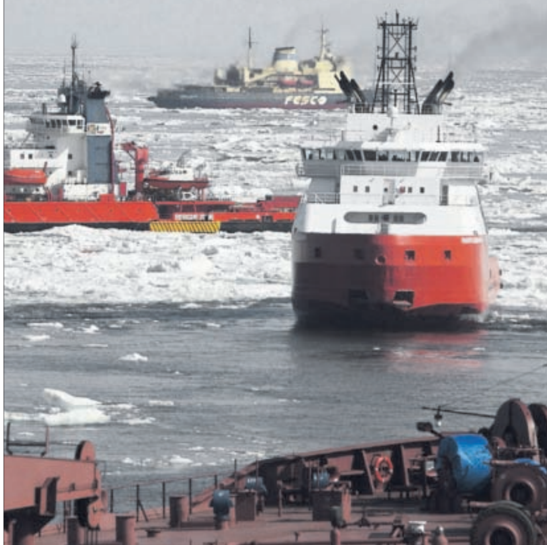
TRAFIKK: Ansvar ved ulykker i Arktis står høyt på møtekartet når Nordisk Råd møtes denne uken i Reykjavik. Både turisttrafikk og annen trafikk øker i arktiske områder, noe som kan bety flere redningsaksjoner i årene som kommer. ILL.FOTO